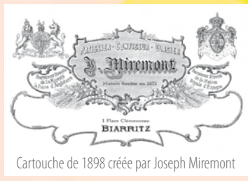
Cartouche de 1898 créée par Joseph Miremont

Eglise Saint Martin : AM du 12/01/1931 Château Boulard : AM du 29/10/1975 Hôtel Plaza : AR du 30/05/1990 Château d'Ilbarritz (Bidart) : AR du 30/05/1990 Casino Municipal : AR du 07/10/1992 Hôtel du Palais : AR du 24/12/1993 Phare : AR du 06/11/2009 Monument aux morts : AR du 21/10/2014 Eglise Orthodoxe : AR du 11/05/2015 Pâtisserie Miremont : AR du 18/01/2006