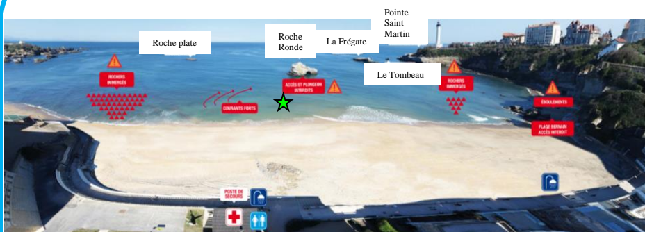
Schéma de la zone de baignade

Nom : Plage du Miramar Commune : Biarritz Département : Pyrénées Atlantiques Région : Aquitaine Responsable Opérationnel : DGS Responsable Administratif : M. Le Maire Période d'Ouverture : du 1/07 au 31/08/2017 Heures de surveillance : 10h à 19h (juillet et août) Fréquentation : 2000 pers. / jours